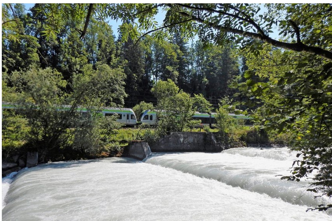
Drei Schwellen beim Rossweidli vermitteln die Kraft des Wassers, mit welcher elektrische Energie für 7700 Haushalte pro Jahr produziert wird. Im Hintergrund die BLS-Strecke Spiez-Frutigen.

Die mehrere Hundert Seiten umfassenden Unterlagen zum Baugesuch sind eine Fundgrube für Interessierte an Naturschutz, Geologie, Hydrologie und Wasserkraftwerktechnik. Sie liegen bis zum 7. August in den Verwaltungen der Gemeinden Aeschi, Spiez und Wimmis auf.